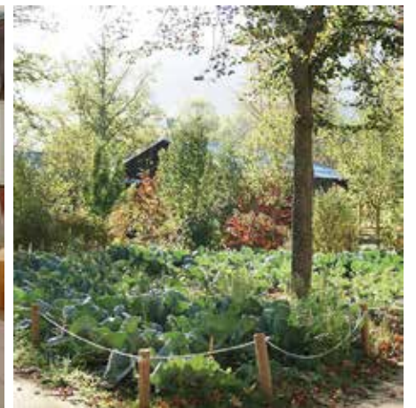
Réinsertion du Chou Quintal d'Auvergne P. 15