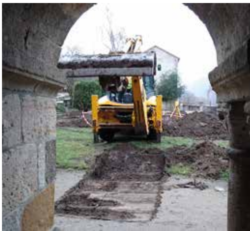
Les réalisations de l'année P. 8