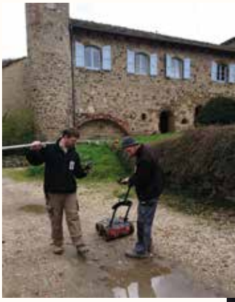
Les archéologues scannent la parcelle du prieuré