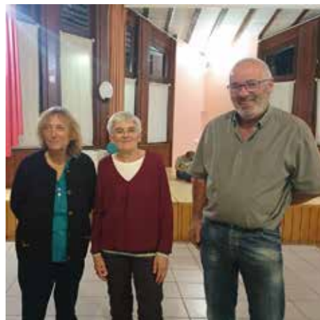
Trois départs à la retraite P. 7