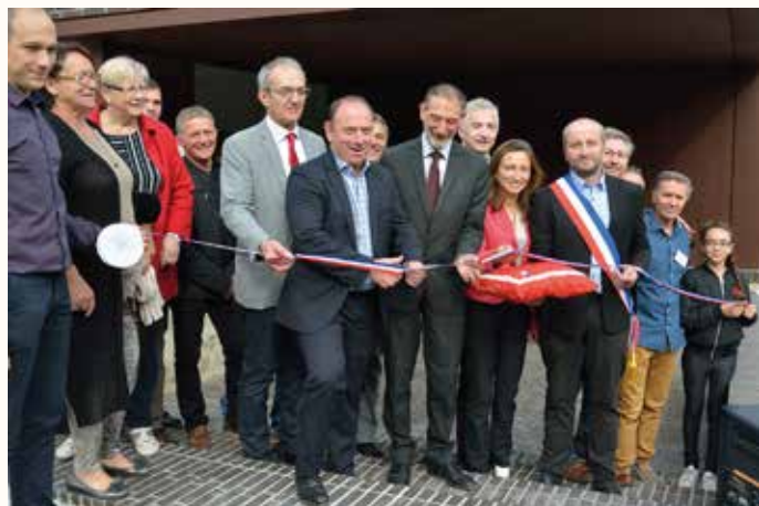
Le sénateur Laurent Duplomb à la manoeuvre !

La nouvelle école municipale a été inaugurée le samedi 21 octobre 2017 en présence de nombreuses personnalités politiques et académiques, qui ont salué l'effort de la municipalité pour adapter son infrastructure scolaire au monde d'aujourd'hui. A cette occasion, après la visite de l'école, les enfants ont donné un spectacle chorégraphique très apprécié sur le parvis de l'église.