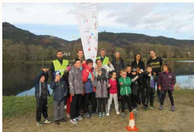
La course des droits de l'enfant avec l'USEP