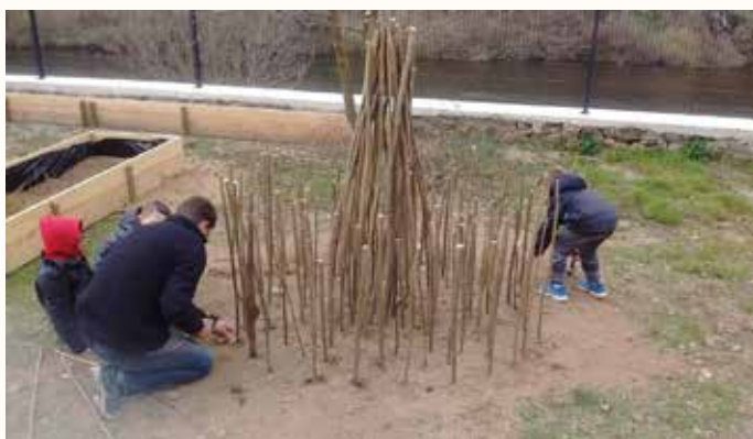
Une séance de land'art

Projet Natur'Art : Les élèves de MS à CE1 ont participé à ce projet fédérateur. Tout au long de l'année, ils ont réalisé des œuvres avec différents matériaux naturels. Jérôme Leyre, artiste local, est intervenu afin de créer une œuvre collective, dans la cour de l'école. Le 8 juin, une exposition des travaux des classes participantes au projet a eu lieu au Puy.