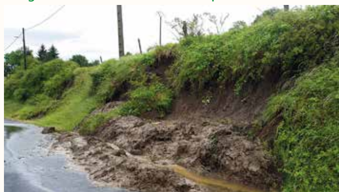
Eboulement sur la route du Chomeil