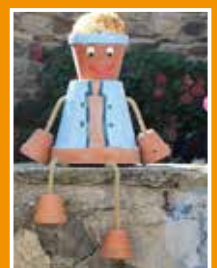
La vie locale P. 12