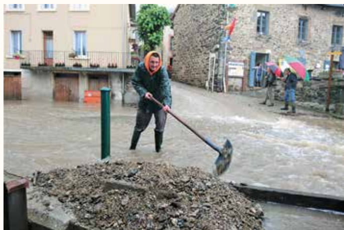
Construction d'une digue de protection devant le logement de la famille Pupin