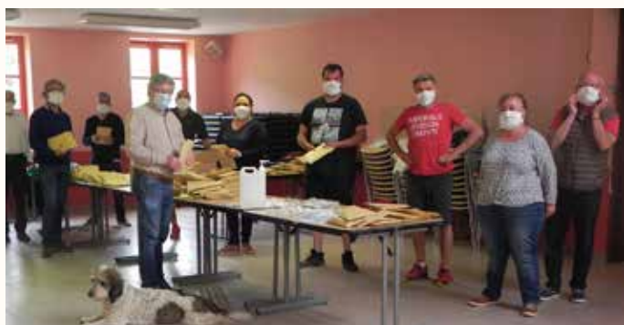
La préparation des masques avant distribution

Dès le début de la crise sanitaire, la municipalité s'est employée à fournir des masques à son personnel technique et administratif, ainsi qu'au cabinet infirmier. Elle a passé ensuite des commandes auprès de l'Association des Maires (500 masques jetables) et de l'Agglo du Puy (700 masques en tissu lavables). S'ajoutent à ces commandes les masques offerts gracieusement par la Région Auvergne-Rhône-Alpes et le Département de la Haute-Loire. Notons que les quantités correspondent au nombre des personnes recensées sur la commune pendant la période de confinement.