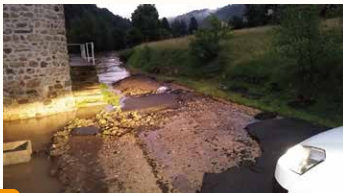
Dégradation de l'enrobé au moulin de Combres