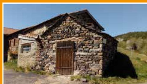
Les réalisations P. 7