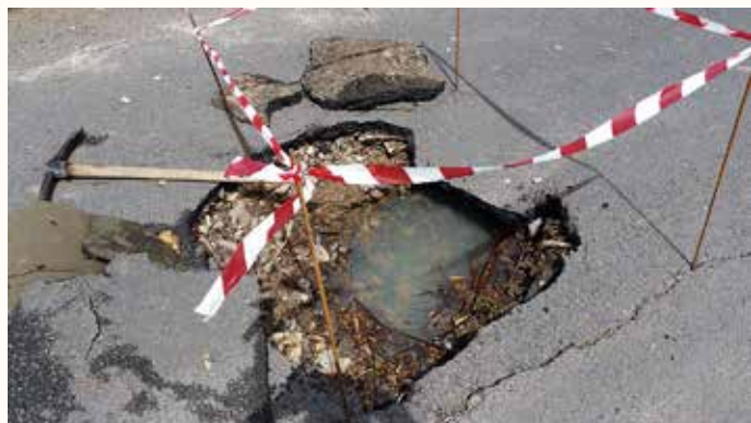
Affaissement de la route sur 20 mètres de canalisation au lavoir de Ventressac

En conséquence, la commune a déposé auprès des services de la préfecture une demande de reconnaissance de l'état de catastrophe naturelle.