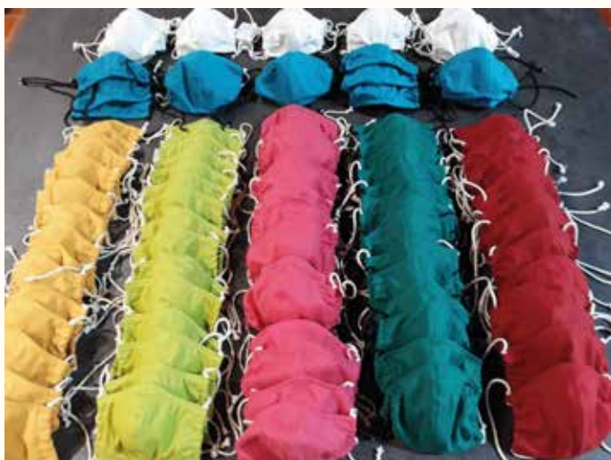
Les masques fabriqués par les bénévoles

Le dimanche 10 mai, en prévision du déconfinement, la municipalité a mis sous enveloppe puis distribué directement dans les boîtes aux lettres les masques offerts par la Région Auvergne-Rhône-Alpes. Il s'agissait de masques en tissu lavables accompagnés d'une notice d'utilisation de la Région. Le vendredi 29 mai, la municipalité a effectué une deuxième distribution de masques, cette fois-ci en provenance du Département. D'autre part, plusieurs bénévoles de la commune ont fabriqué 100 masques en tissu lavables dont ont pu disposer les enfants de l'école dans le cadre de sa réouverture.