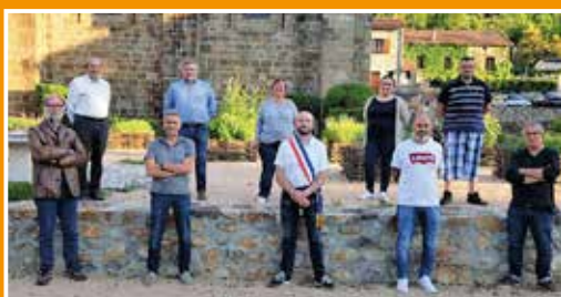
L'élection du Maire P. 4