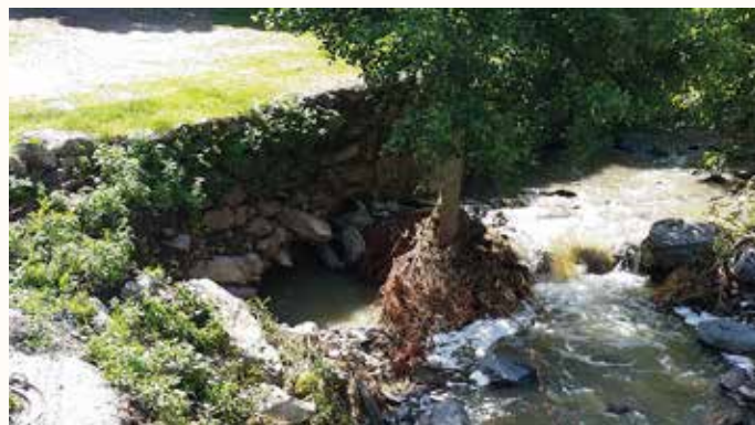
Dégradation du mur attenant au pont de Combres