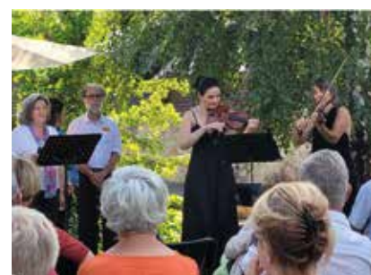
Vie locale P.12