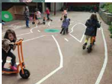
Le circuit vélos et trottinettes