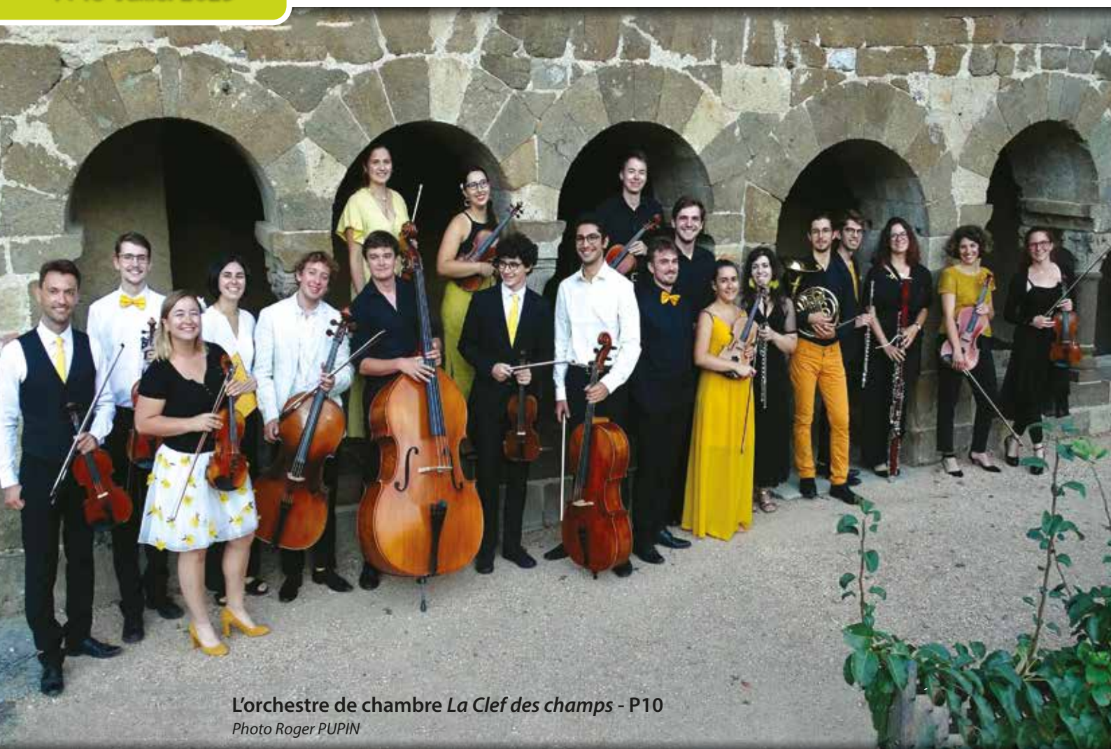
L'orchestre de chambre La Clef des champs - P10