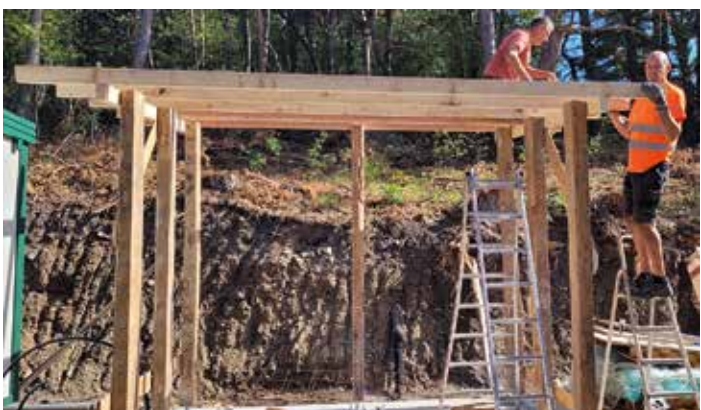
L'espace de dépeçage