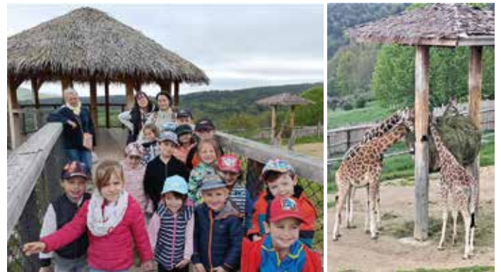
Les enfants en visite au parc animalier

Les 5 et 6 juin, les élèves de CE/CM se sont rendus dans le Puy-de-Dôme pour visiter le parc de Vulcania, ainsi que celui du Volcan de Lemptégny.