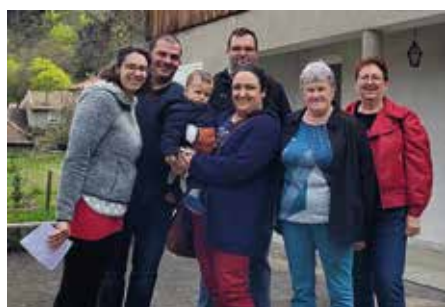
Zoom sur la MAM P.4