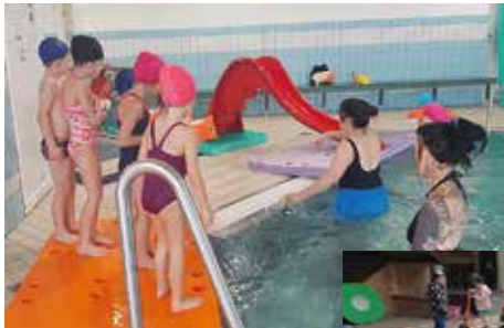
Les enfants à la piscine

Enfin, la municipalité a réalisé des tracés au sol dans la cour de récréation afin de délimiter un circuit pour les vélos et trottinettes. Ces derniers sont très appréciés par les élèves !